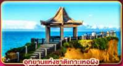
อุทยานแห่งชาติเกาะทองผิ้ว

ชมเทศกาลข้ามปีฉลองเทศกาลปีใหม่ 2027 แช่น้ำแร่ส่วนตัวในห้องพัก