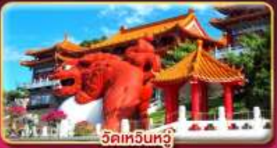
วัดหัวหน่วง