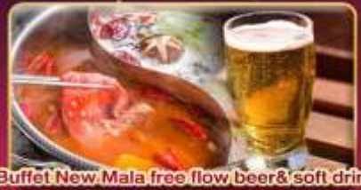
*Buffet New Mala free flow beer & soft drink