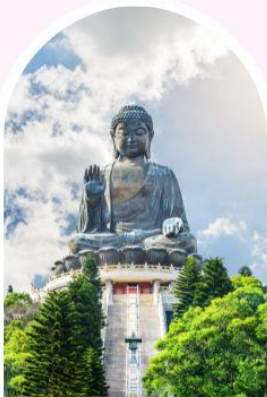
นั่งกระเชานองปิง นมัสการพระใหญ่โป้วหลิน