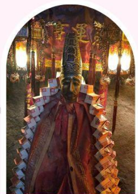
วัดหลินฟ้า โชคลาภและความมั่งคั่ง