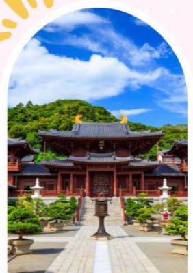
วัดนางชีฉีหลิน สวนหนานเหลียน