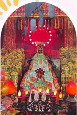
วัดเจ้าแม่กวนอิมอ่องอ่า ขอพรเรื่องเงิน ทรัพย์สิน และความมั่งคั่ง