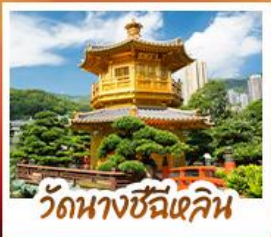
วัดนางชีฉีเสียน