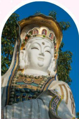
ริฟลิสเบย์ รับพลังงานดี เสริมพลังดวงจู้ย