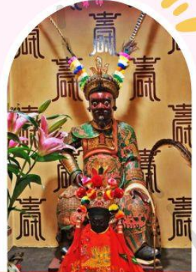
วัดเซ่งจ้งเก้งเก่าแก่ 400 ปี ไซกง