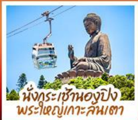
นั่งกระเช้าองปัง พระใหญ่เกาะคันทา