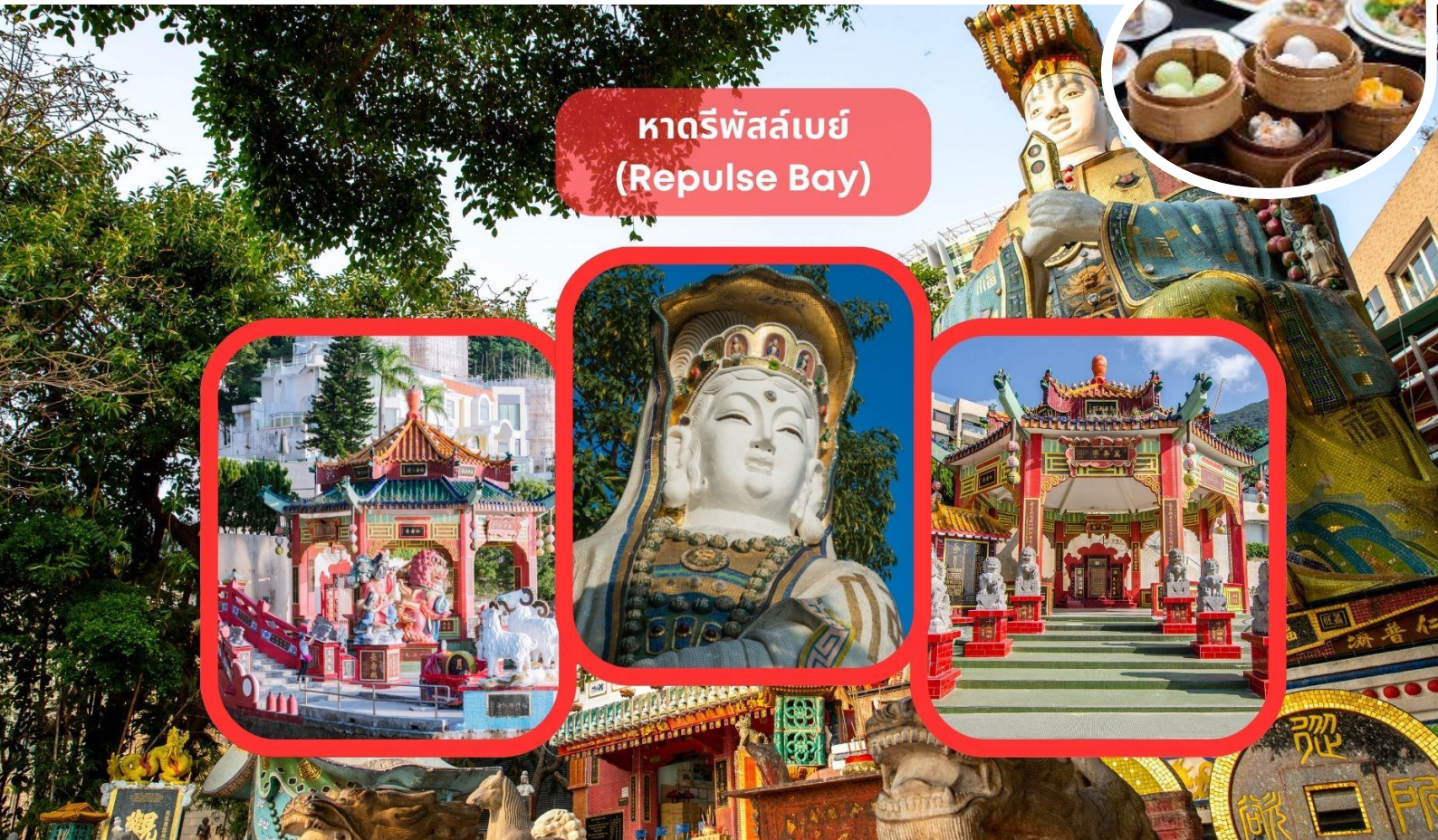
หาดรีพัลส์เบย์ (Repulse Bay)

รับประทานอาหารเช้า ณ ภัตตาคาร บริการท่านด้วยเมนูติ่มซำฮ่องกง (มื้อที่ 1)