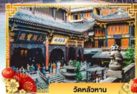
วัดหลัวฮาน