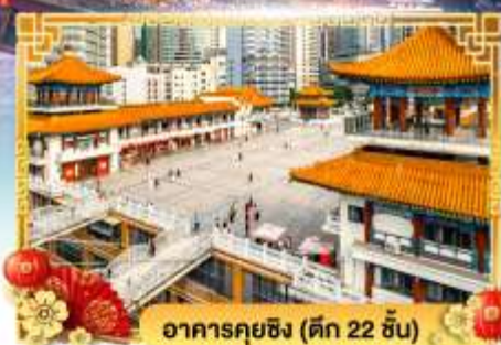
อาคารคุยซิง (ดิค 22 ชั้น)