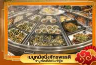
เมนูหมื่นสิ่งจักรพรรดิ