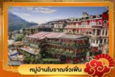
หมู่บ้านโบราณจ่งเฟิน