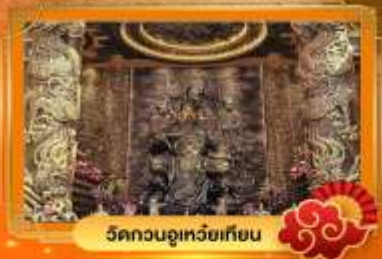
วัดกวนอูเหยี่ยวเทียน