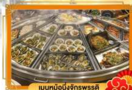
เมนูหม้อนึ่งจักรพรรดิ