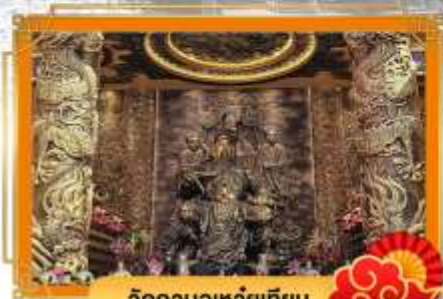
วัดกวนอูเหวยเทียน