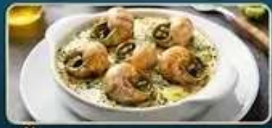
ลิ้มลองเมนูหอยเอสคาโก้