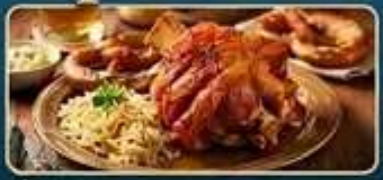
อ้มอร่อยเมนูขามูเยอรมัน