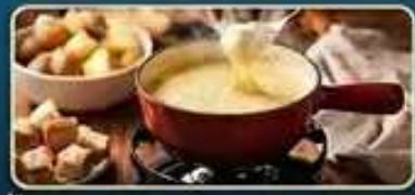
ลิ้มลองเมนูฟองดูร์ สไตส์สวิส