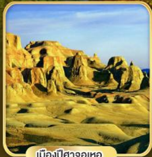
เมืองปีศาจอุเทอ

...อสังการคานาสือ เยือนหมู่บ้านนิทานเหม่อ 8 วัน 7 คืน ฤดูใบไม้ร่วง ฤดูใบไม้ร่วง