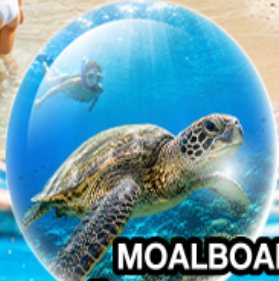
MOALBOAL ISLAND HOPPING (ดำน้ำดูปลา, เต่า, ว่ายน้ำกับปลาชาร์ตัน)