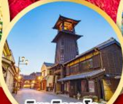
ลิตเติลเอโดะ เมืองคาวาโกเอะ