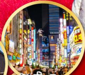
ฮ็อปปิง ซินจูกุ