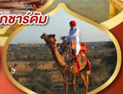
ฟรี ขี่อูฐ เมืองมันทวา ราคาเริ่มต้น