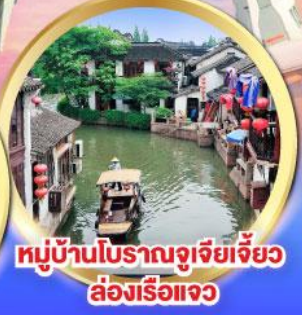
หมู่บ้านโบราณจูเจียเจี้ยว ล่องเรือแจว