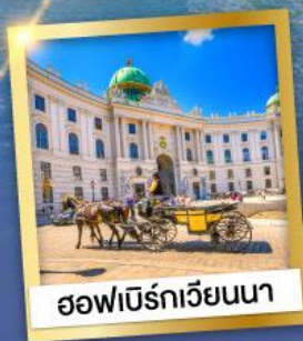
ออฟเบิร์กเวียนนา

เข้าชมความงดงามภายใน ของปราสาทนอยชวานสไตน์