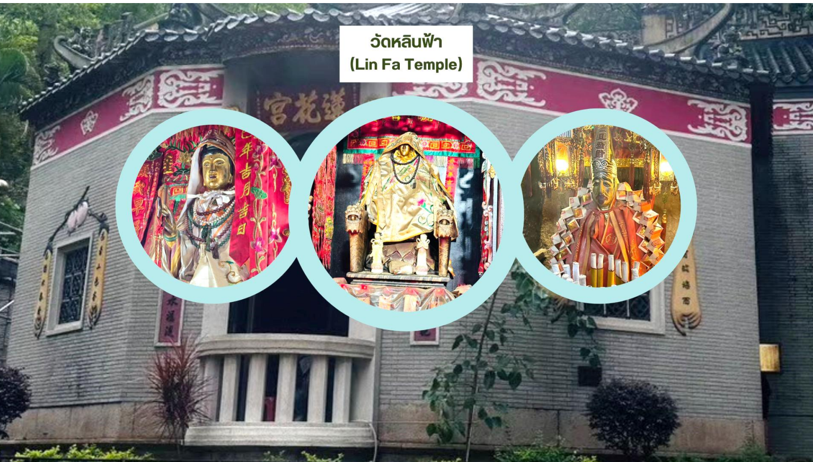
วัดหลินฟ้า (Lin Fa Temple)

เรียกว่ามาทีเดียวได้ขอพรกันครบเลย ไม่ว่าจะใครจะขอพรอันใดก็สมหวัง สมความปรารถนาทุกประการ