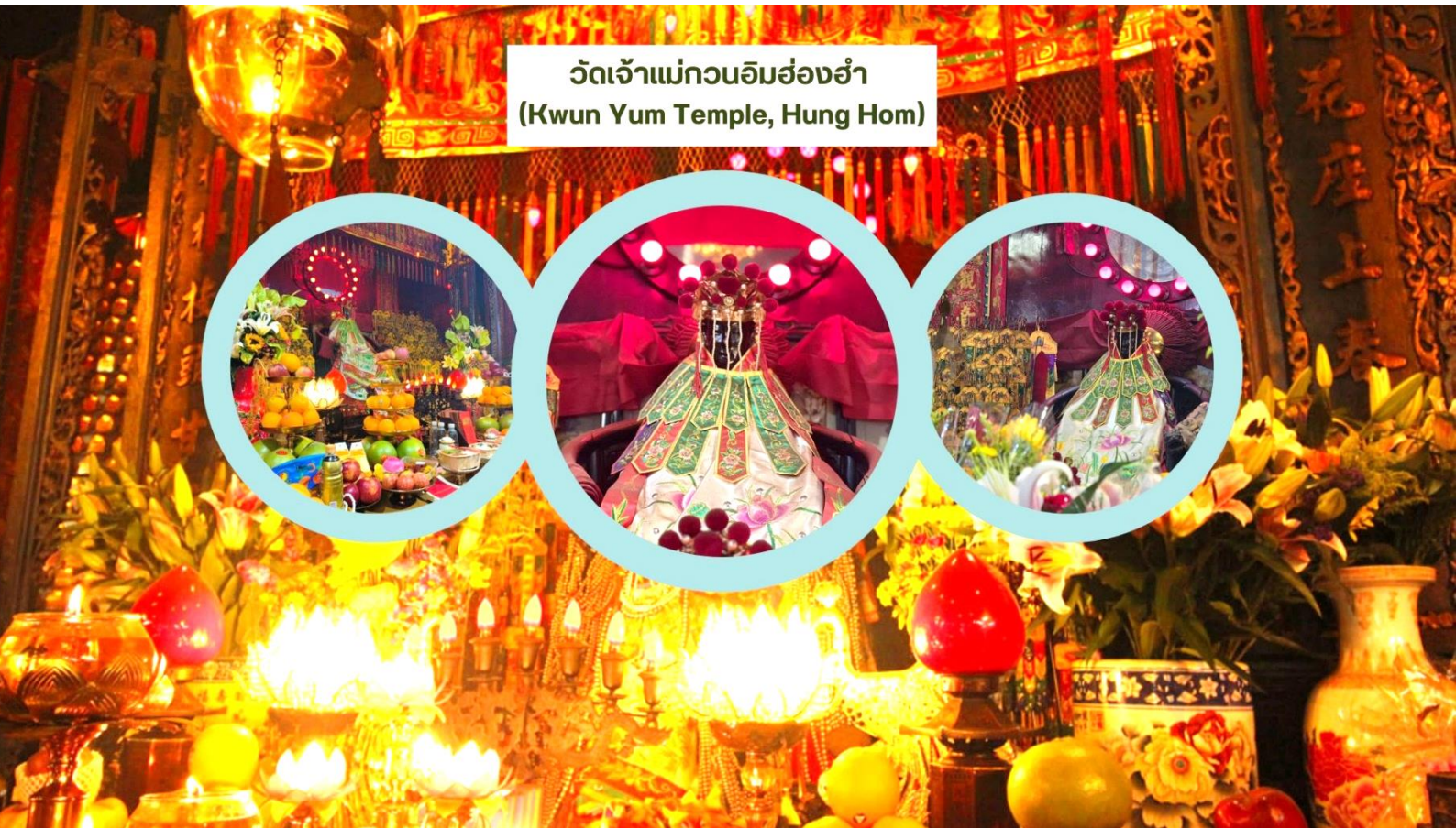
วัดเจ้าแม่กวนอิมฮ่องกง (Kwun Yum Temple, Hung Hom)

นำท่านเดินทางสู่ วัดเจ้าแม่กวนอิมฮ่องกง (Kwun Yum Temple, Hung Hom) เป็นวัดเล็กๆ อันเก่าแก่ ถูกสร้างมาตั้งแต่ปี พ.ศ. 2416 วัดนี้เคยมีปาฏิหาริย์เกิดขึ้น เมื่อช่วงสงครามโลกครั้งที่ 2 มีการปล่อยระเบิดลงบริเวณวัดฮ่องกงหลายต่อหลายครั้ง ซึ่งทำให้มีผู้บาดเจ็บล้มตายเป็นจำนวนมากทว่าชาวบ้านที่เข้าไปหลบภัยในวัดฮ่องกงกลับปลอดภัยไม่ได้รับความบาดเจ็บ รวมถึงตัววัดก็ไม่ได้ได้รับความเสียหายแบบน่าเหลือเชื่อ จึงทำให้ชาวบ้านศรัทธาและเลื่อมใสในวัดแห่งนี้มากยิ่งขึ้น และมีลักษณะสถาปัตยกรรมแบบวัดจีนดั้งเดิม วัดแห่งนี้มีชื่อเสียงโด่งดังในเรื่องของ “พิธียืมเงินเทพเจ้า” เพื่อให้เราร่ำรวยเงินทอง เงินไหลกองทองไหลมา โดยปกติทางวัดจะมีการจัดเทศกาลพิธียืมเงินเทพเจ้าโดยเฉพาะ แต่นอกจากนั้นในวันปกติก็สามารถมาทำพิธีขอได้ตามปกติ วิธีการไหว้และขอพร