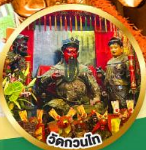
วัดกวนโก ขอพรเทพเจ้ากวนอู เงินทอง, ธุรกิจมั่นคง