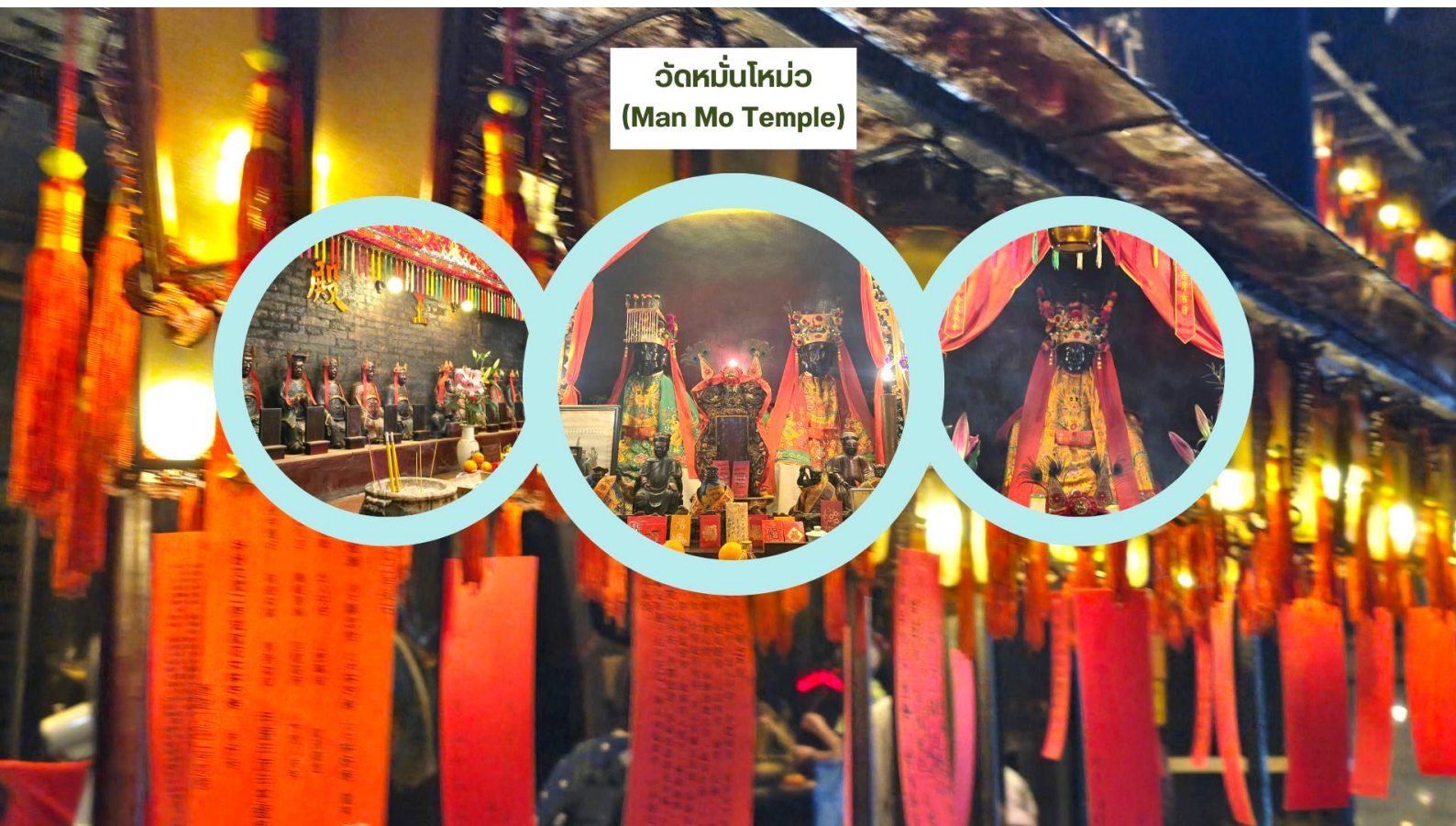
วัดหมั่นโหม่ว (Man Mo Temple)