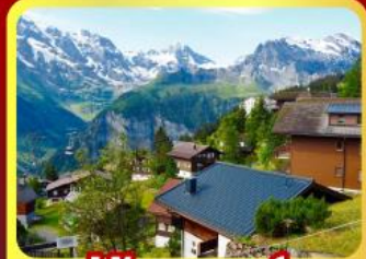
หมู่บ้านเมอร์สเรน