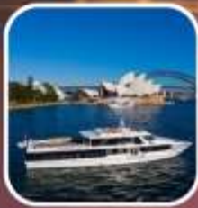
ล่องเรือชมอ่าวซิดนีย์