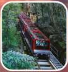
อุทยานขลุ่ยเมาทักเท็นส์