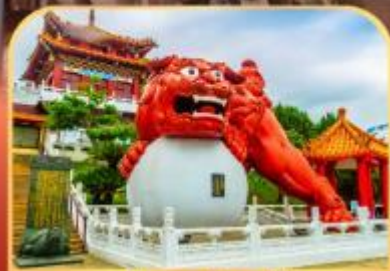
วัดเหวินหนู่