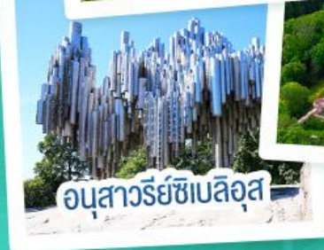
อนุสาวรีย์เซเปิลอส

ฟินแลนด์ - เอสโตเนีย - ลัตเวีย - ลิทัวเนีย แวะเที่ยวเซี่ยงไฮ้