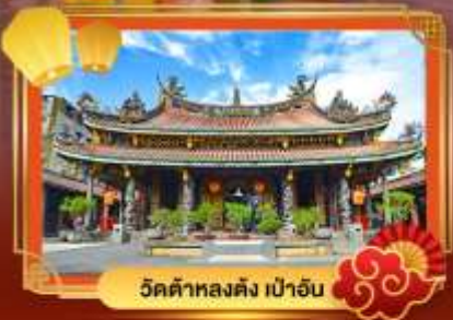
วัดต้าหลงตง เป่าอัน